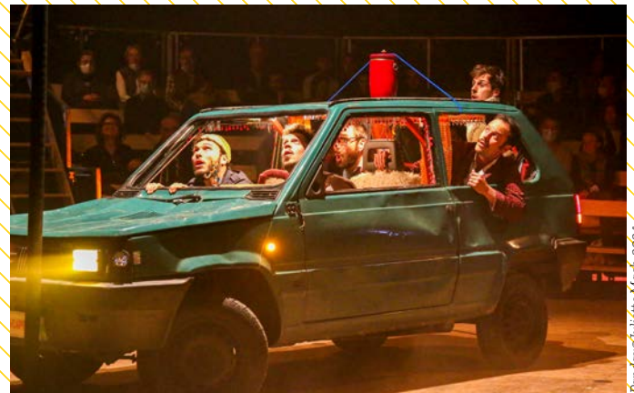
Fondation Juliette Magh - 2024