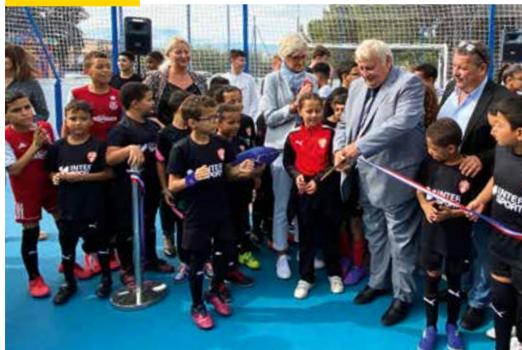
Inauguration de l'espace multi-sports santé inclusif du Prépaou, le 28 septembre

Vice-président de la Métropole Aix-Marseille-Provence, délégué à la sidérurgie, à la pétrochimie et à l'aéronautique.