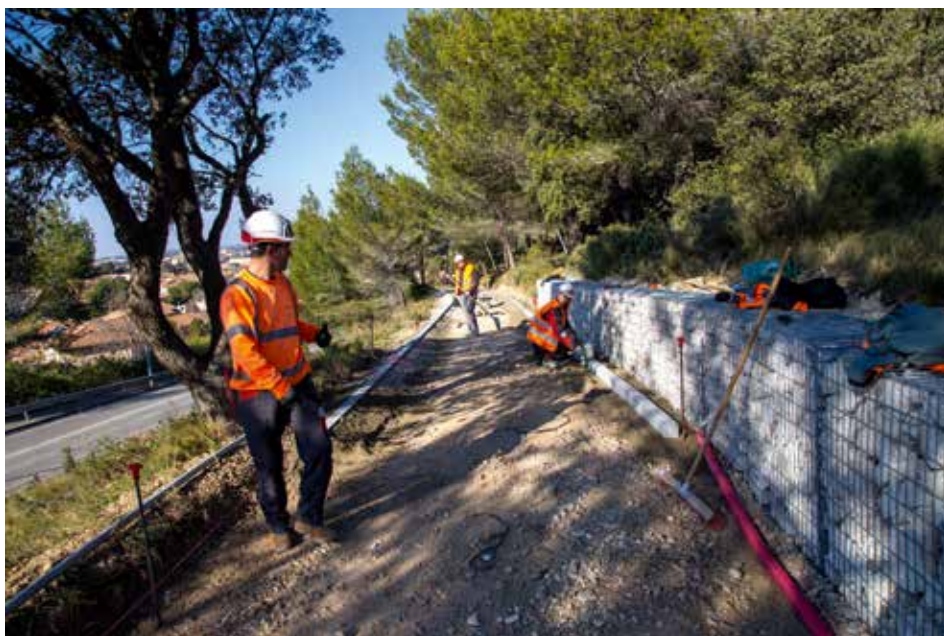
La première « ligne » de piste cyclable, actuellement en travaux entre le lycée Latécoère et la plage de la Romaniquette, sera mise en service avant l'été.

passage à l'endroit nécessaire, études à l'appui. La mise en service de cette première ligne, budgétée à 950 000€, est prévue avant cet été.