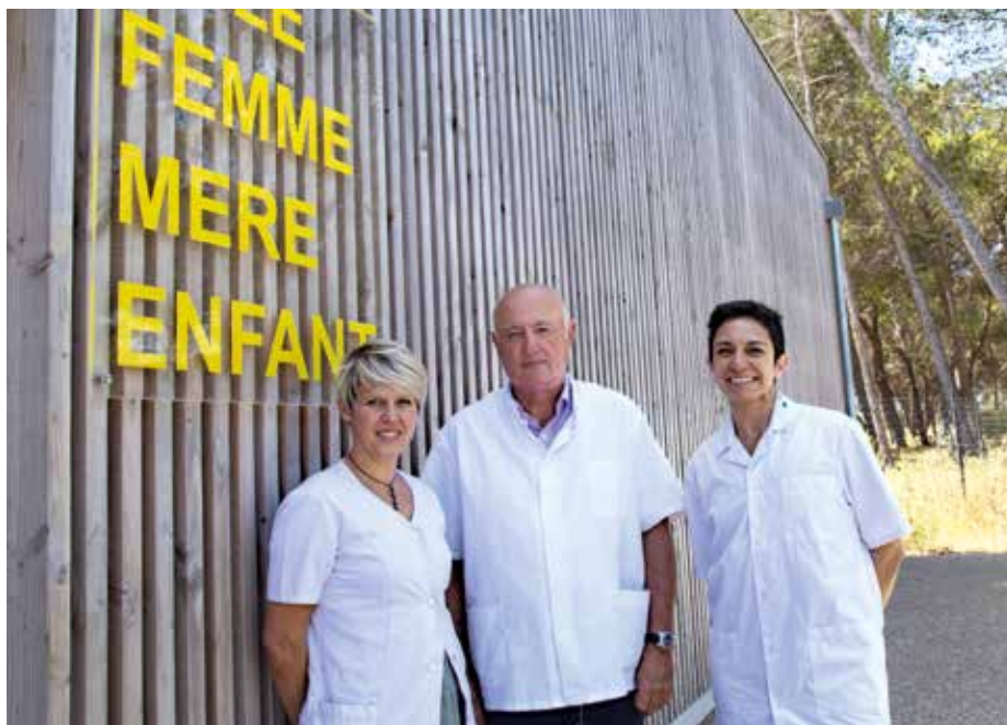
Le Dr Donnadiu accompagné de deux sages-femmes de la structure

Pour proposer une solution à la densité médicale dans les domaines gynécologiques et pédiatriques, la ville a ouvert depuis le 1er avril 2019, le pôle de santé femme mère enfant « Simone-Veil ». Une structure moderne et performante qui a permis d'étendre l'offre de service en matière de santé publique à Istres avec succès.