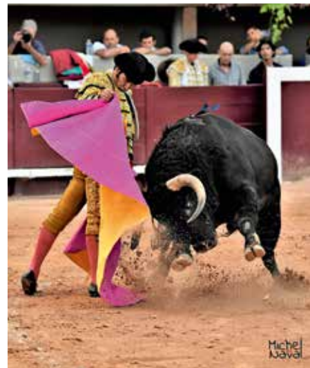
Morante de la Puebla