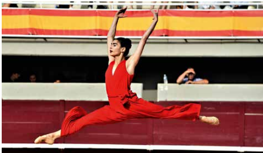
La danseuse Angélique Blasco