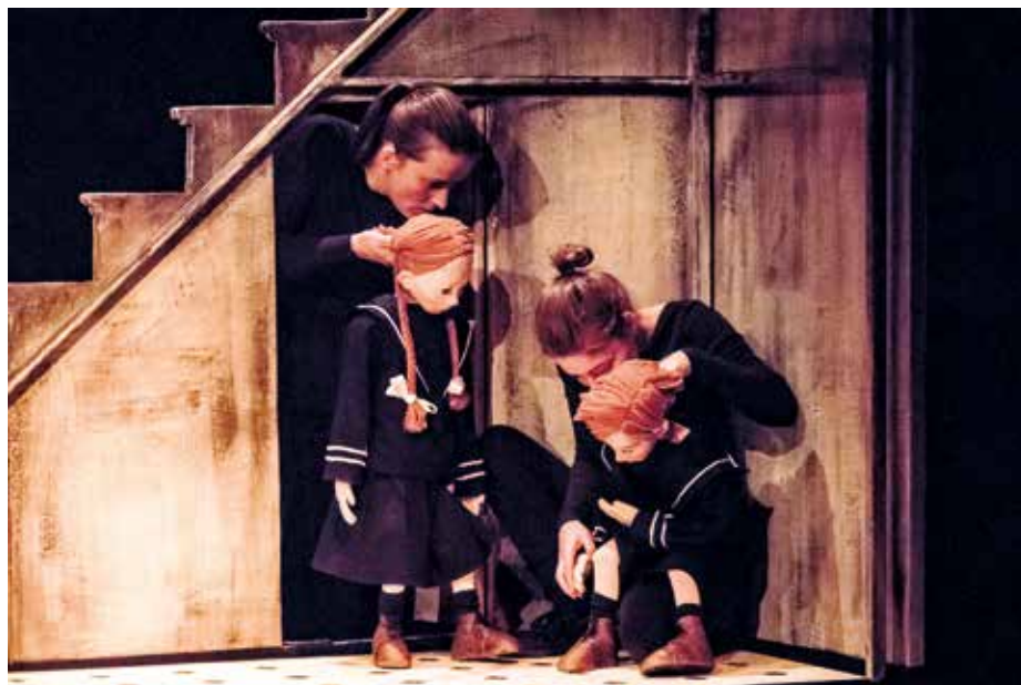
Bon Debarras.

Amateurs de cirque et de magie, le théâtre de l'Olivier risque fort de devenir votre chapiteau préféré ! Avec « Est-ce que je peux sortir de table ? », la compagnie « Théâtre Bascule » nous invite à un repas de famille qui n'en finit pas. Au milieu de ce dernier, une fillette qui s'ennuie se met à s'envoler, monter sur une fourchette géante, rouler sur un très