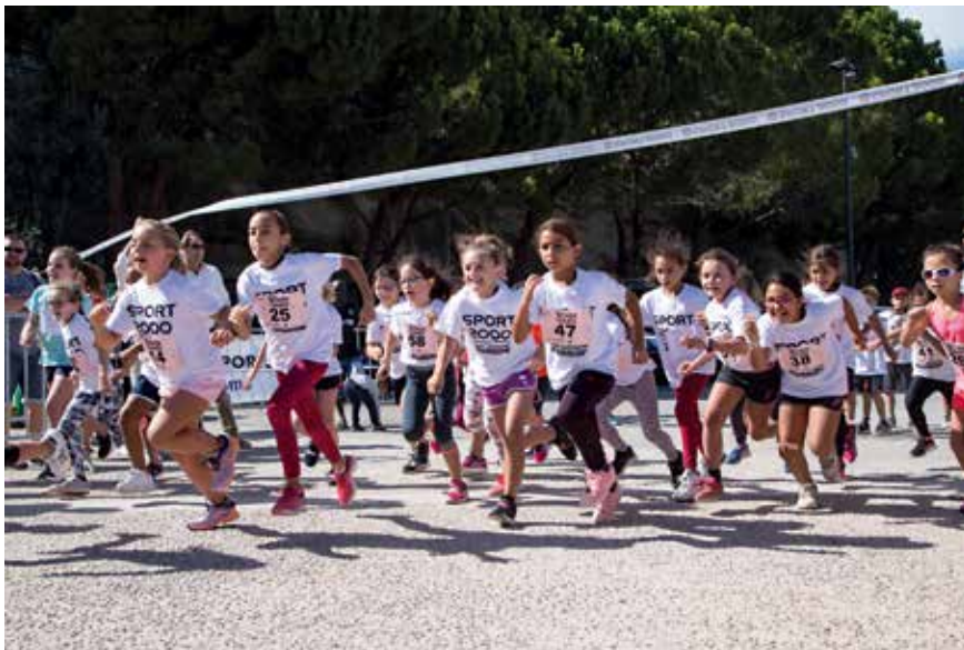
P. 4 À 7 / L'ACTUALITÉ EN IMAGES