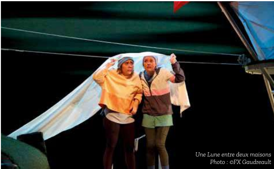
Une Lune entre deux maisons