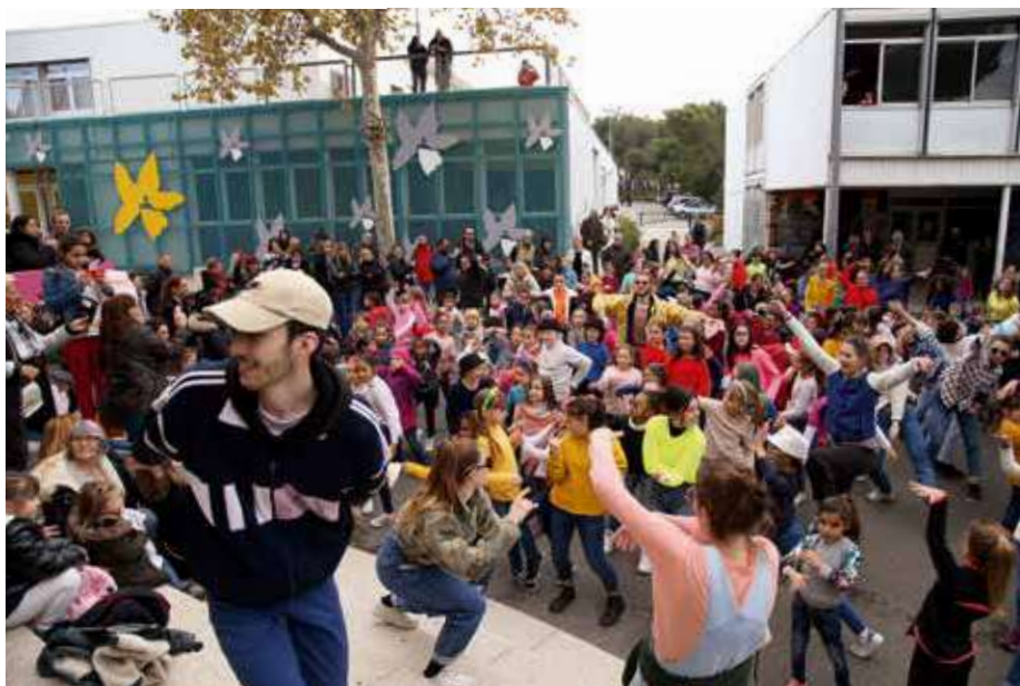
Le 20 novembre, Pulsion organisait au CEC un "Flashmob" pour saluer les 30 ans des droits de l'enfant.

Parmi les acteurs principaux à l'origine de l'événement, on retrouve les écoles municipales du sport, les danseurs de Coline et de Pulsion, le centre social des quartiers Sud, mais aussi la ludothèque, la compagnie d'improvisation La KIFFF, le cinéma Le Coluche, sans oublier le Réseau Istréen de Prévention de l'Enfance en Danger