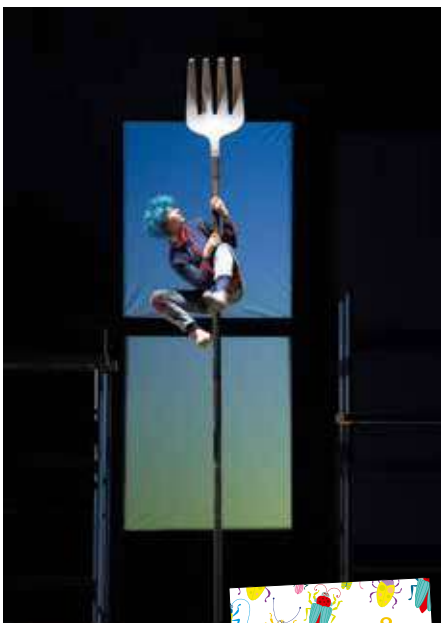
Est-ce que je peux sortir de table.