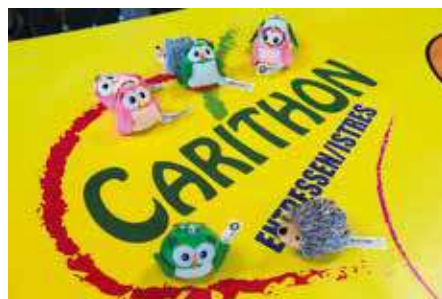
Les porte-clés du Téléthon vendus au prix de 2 €

Plus d'informations sur la page Facebook « Carithon Entressen Istres ».