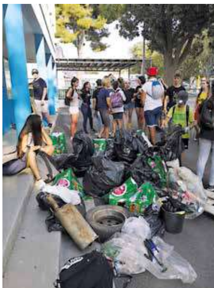
La collecte de la "Clean walk" du mois d'août à Istres

Pour communiquer sur leurs actions, les deux amies ont notamment créé une page instagram (@Cleanwalkers.istres), qui compte déjà plus de 130 abonnés. Le prochain rendez-vous est prévu pendant les vacances de Noël !