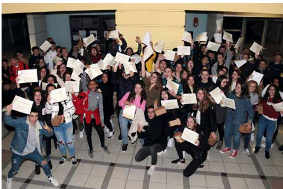
En haut : remise du Brevet National des Collèges aux collégiens de Pasteur, ci-dessus aux collégiens de Coutarel.