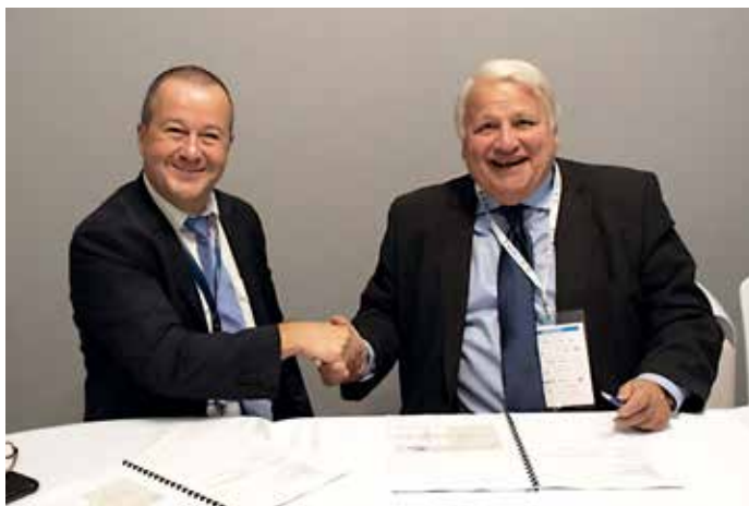
Ci-contre, lors de la signature du bail avec la société AeroTech Pro qui s'installera prochainement dans le hall Mercure.