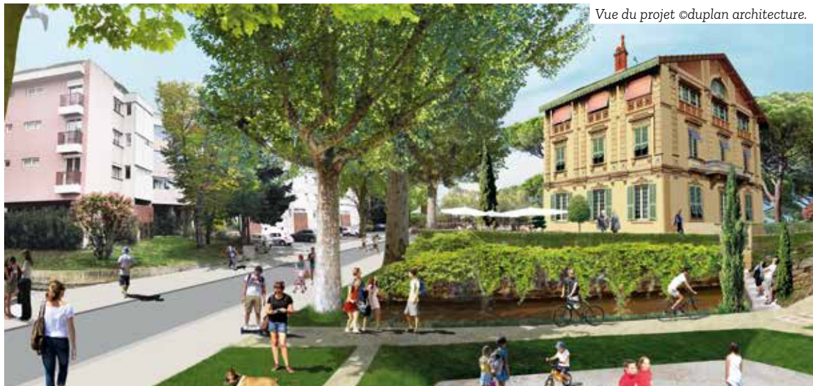
Vue du projet ©duplan architecture.