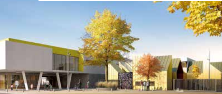
Vue générale du groupe scolaire et du multi-accueil collectif de Trigance