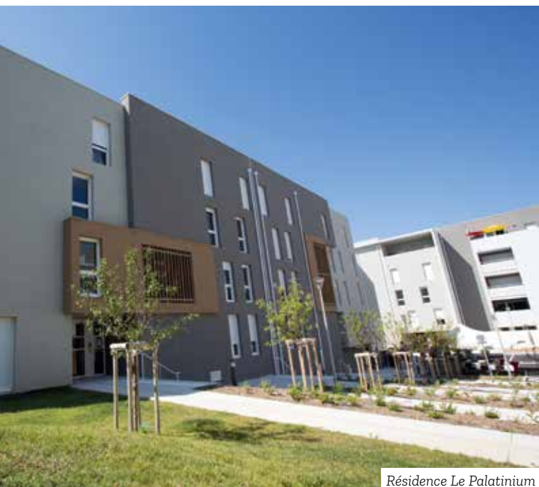
Résidence Le Palatinium