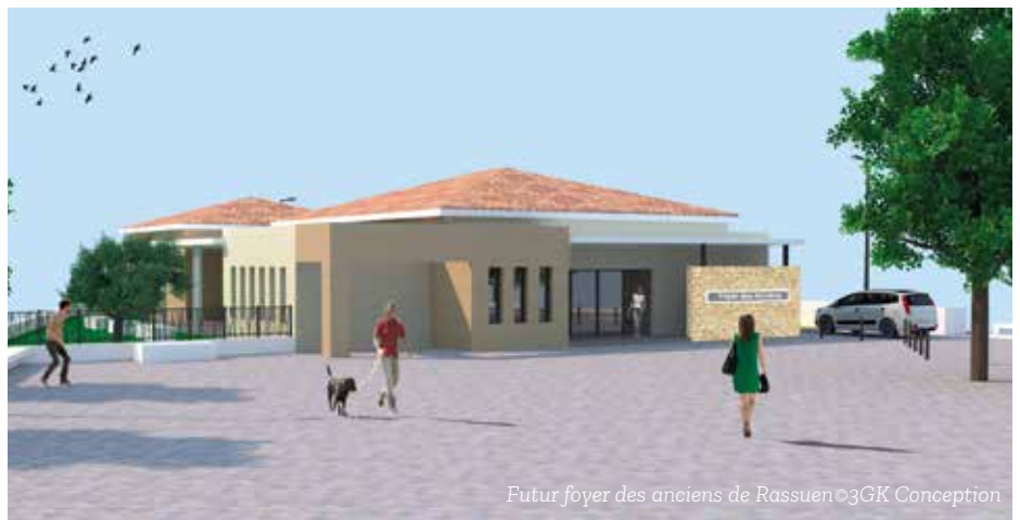
Futur foyer des anciens de Rassuen