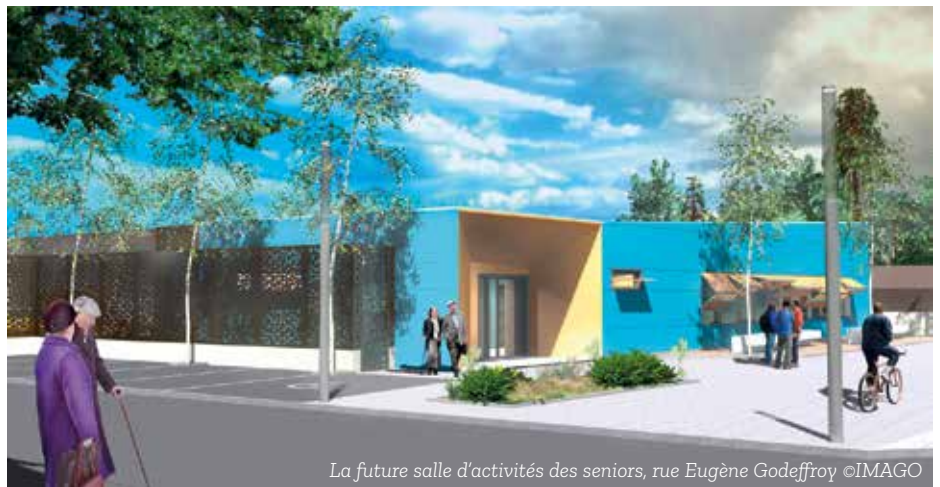
La future salle d'activités des seniors, rue Eugène Godeffroy