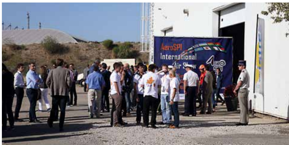
Ci-dessus, une première édition réussie pour le salon international AeroSpi.

Mais l'immense Hall Mercure, qui est cloisonné en plusieurs espaces, accueillera également des activités de maintenance. Un bail a ainsi été signé avec un acteur clé du secteur, la société AéroTechPro, qui louera 10 000m 2 dès avril 2019 et y assurera la maintenance d'avions de la flotte militaire française ou d'avions commerciaux. D'autres acteurs majeurs de l'aéronautique, sont attendus dans le hall mercure pour y développer leurs projets ou leurs activités, au plus près de la piste la plus longue d'Europe et de l'écosystème dédié aux essais et à la certification. Signe de son rayonnement et de son potentiel, en septembre dernier, le pôle aéronautique a accueilli le premier salon aéronautique de la région Sud PACA (AeroSPI), organisé par la société VSM, implantée sur le site. De nombreux professionnels ont à cette occasion découvert les opportunités d'installation de leur entreprise à Istres.