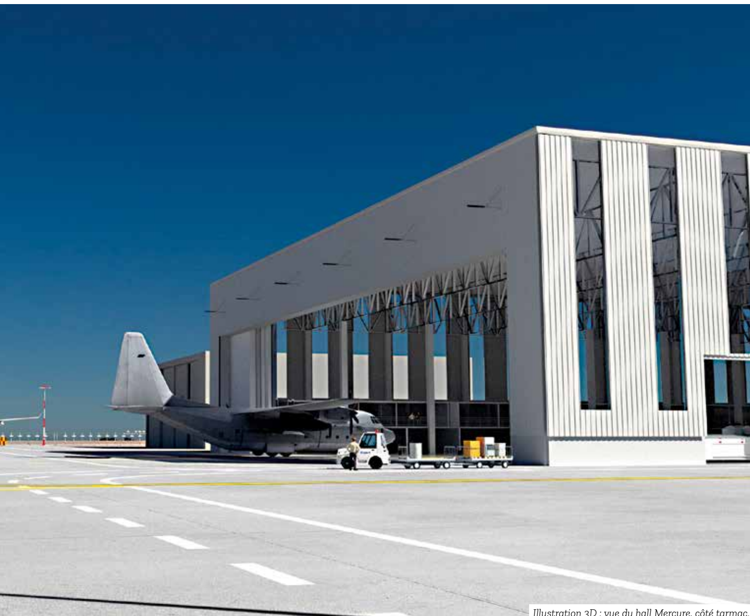
Illustration 3D : vue du hall Mercure, côté tarmac.