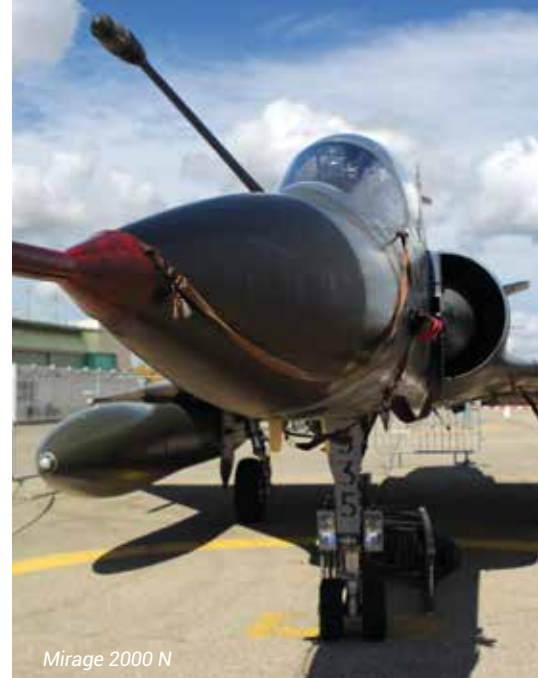
Mirage 2000 N