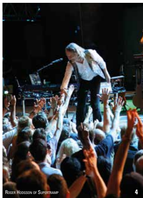
ROGER HODGSON OF SUPERTRAMP