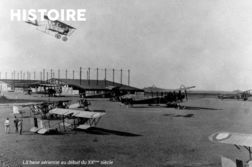
La base aérienne au début du XX ème siècle