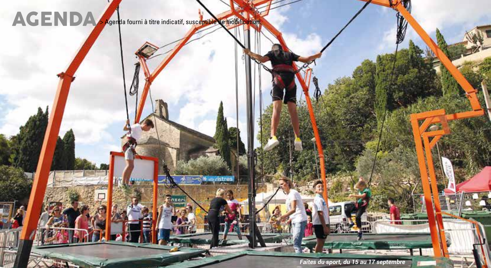
Faîtes du sport, du 15 au 17 septembre