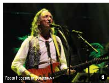
ROGER HODGSON OF SUPERTRAMP