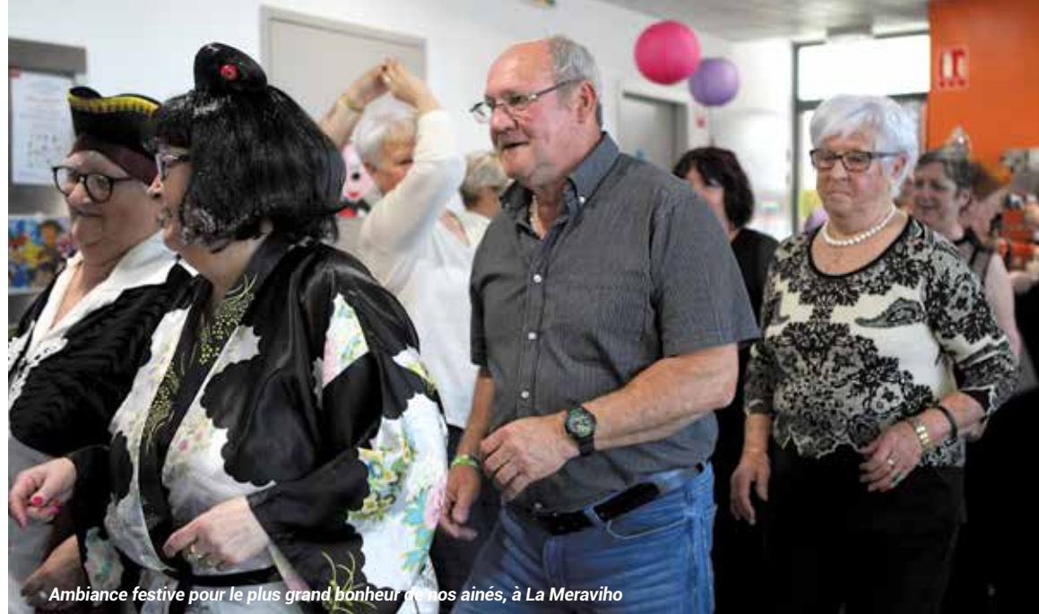
Ambiance festive pour le plus grand bonheur de nos aînés, à La Meraviho