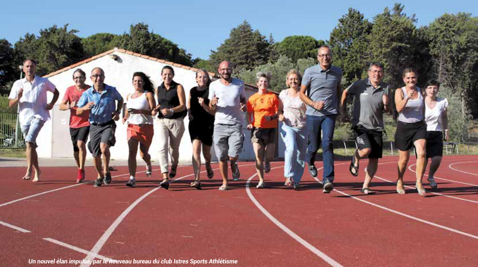
Un nouvel élan impulsé, par le nouveau bureau du club Istres Sports Athlétisme