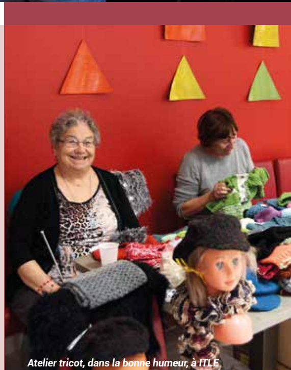
Atelier tricot, dans la bonne humeur, à ITLE