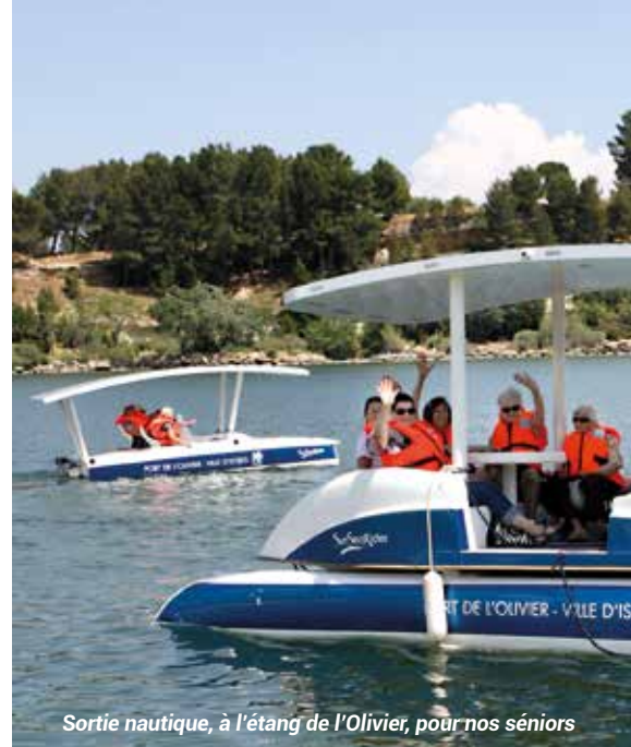
Sortie nautique, à l'étang de l'Olivier, pour nos séniors