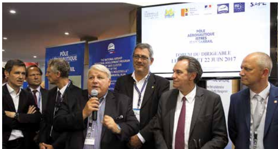
Au salon du Bourget, le 23 juin, lors de la présentation du pôle aéronautique, aux côtés d'industriels déjà implantés et du Président du Conseil Régional PACA

Le Pôle aéronautique Jean-Sarrail, implanté en toute proximité de la Base Aérienne 125 est une opération économique d'envergure portée par le maire d'Istres, qui souhaite favoriser la création d'activités et donc d'emplois sur la commune.