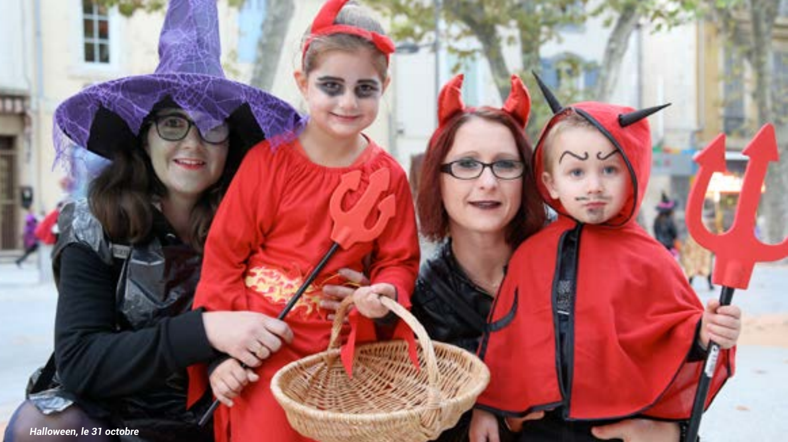
Halloween, le 31 octobre