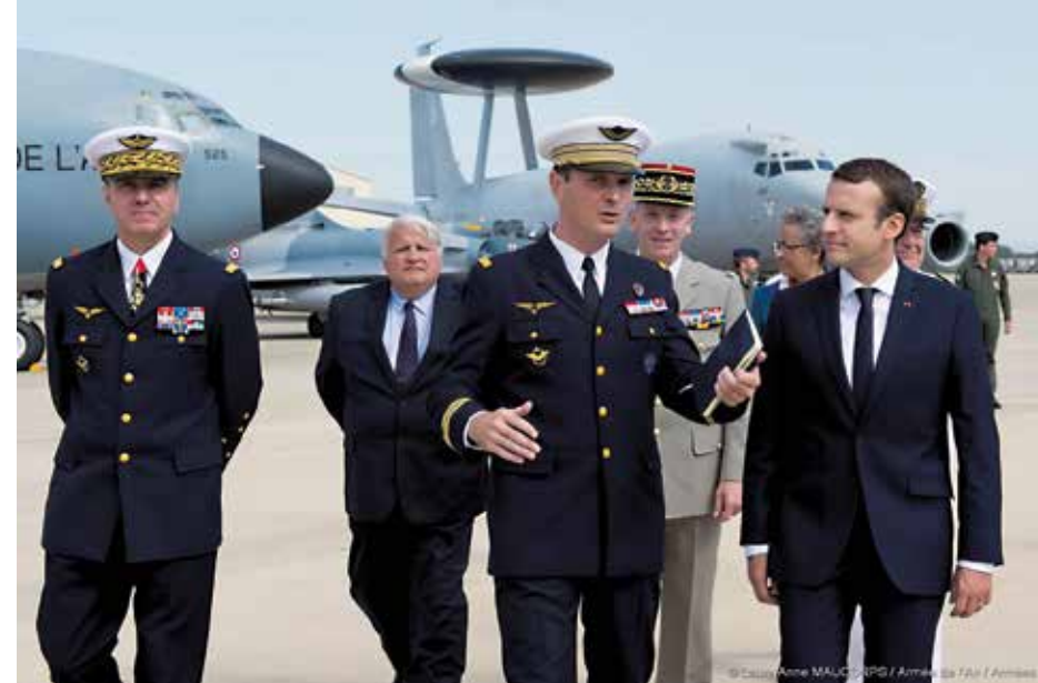
Lors de la visite du Président Macron à Istres, le 20 juillet, qui a rappelé l'importance stratégique de la B.A.125.