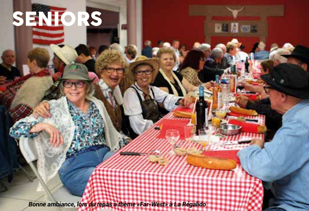
Bonne ambiance, lors du repas à thème «Far-West» à La Régalido