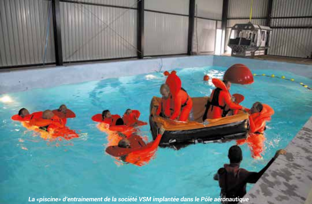
La « piscine » d'entraînement de la société VSM implantée dans le Pôle aéronautique