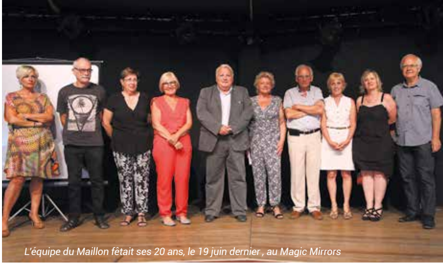
L'équipe du Maillon fêtait ses 20 ans, le 19 juin dernier, au Magic Mirrors