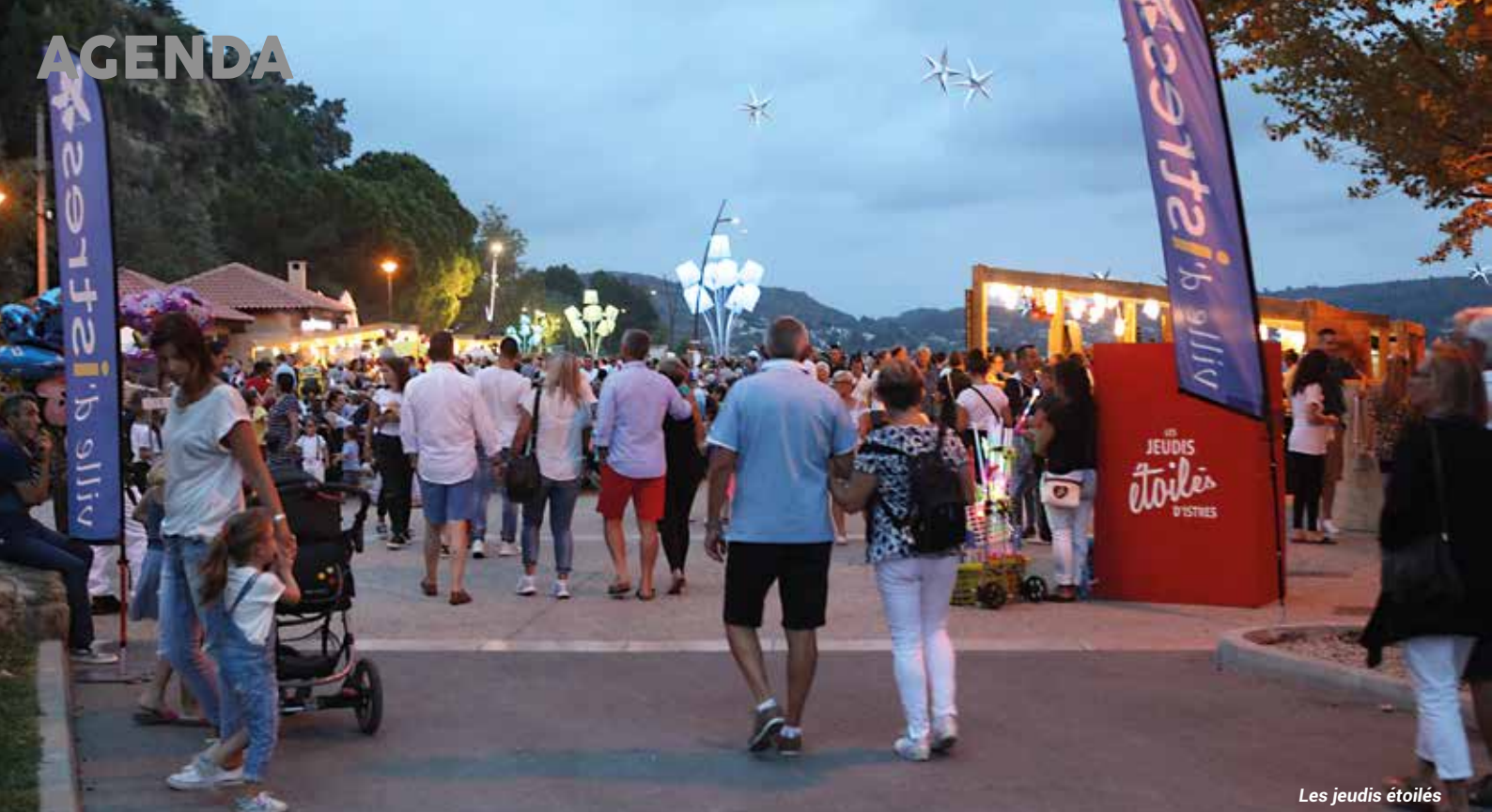
Les jeudis étoilés