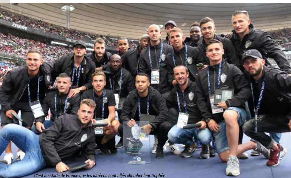
C'est au stade de France que les istréens sont allés chercher leur trophée.