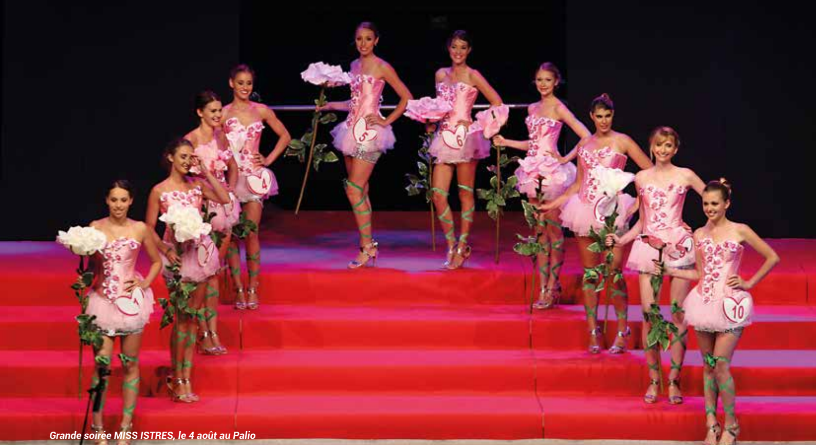
Grande soirée MISS ISTRES, le 4 août au Palio