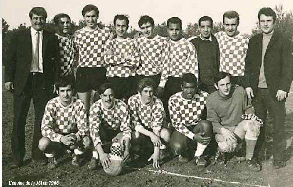
L'équipe de la JSI en 1966