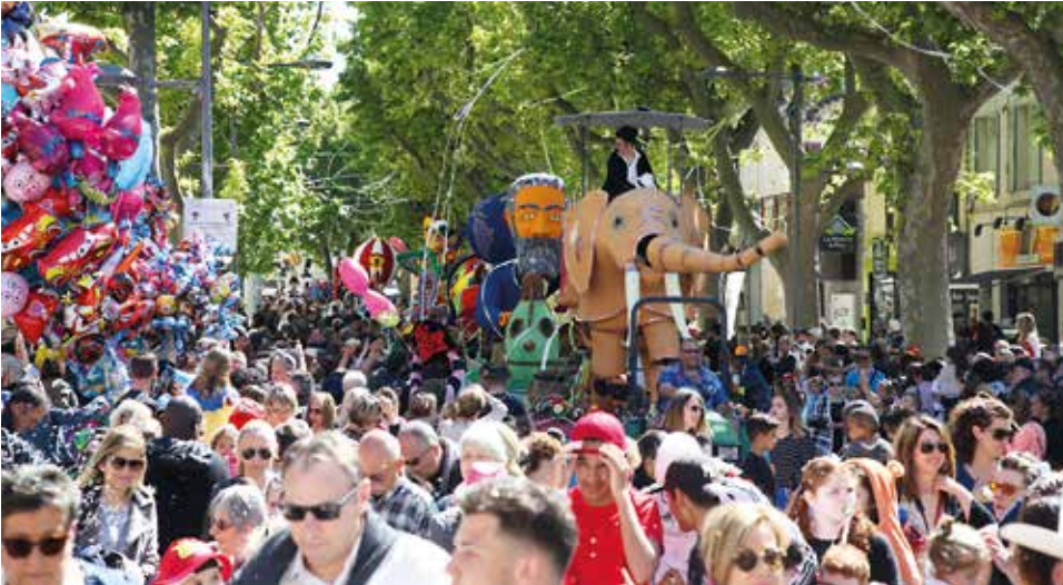
Le carnaval, 29 avril 2017