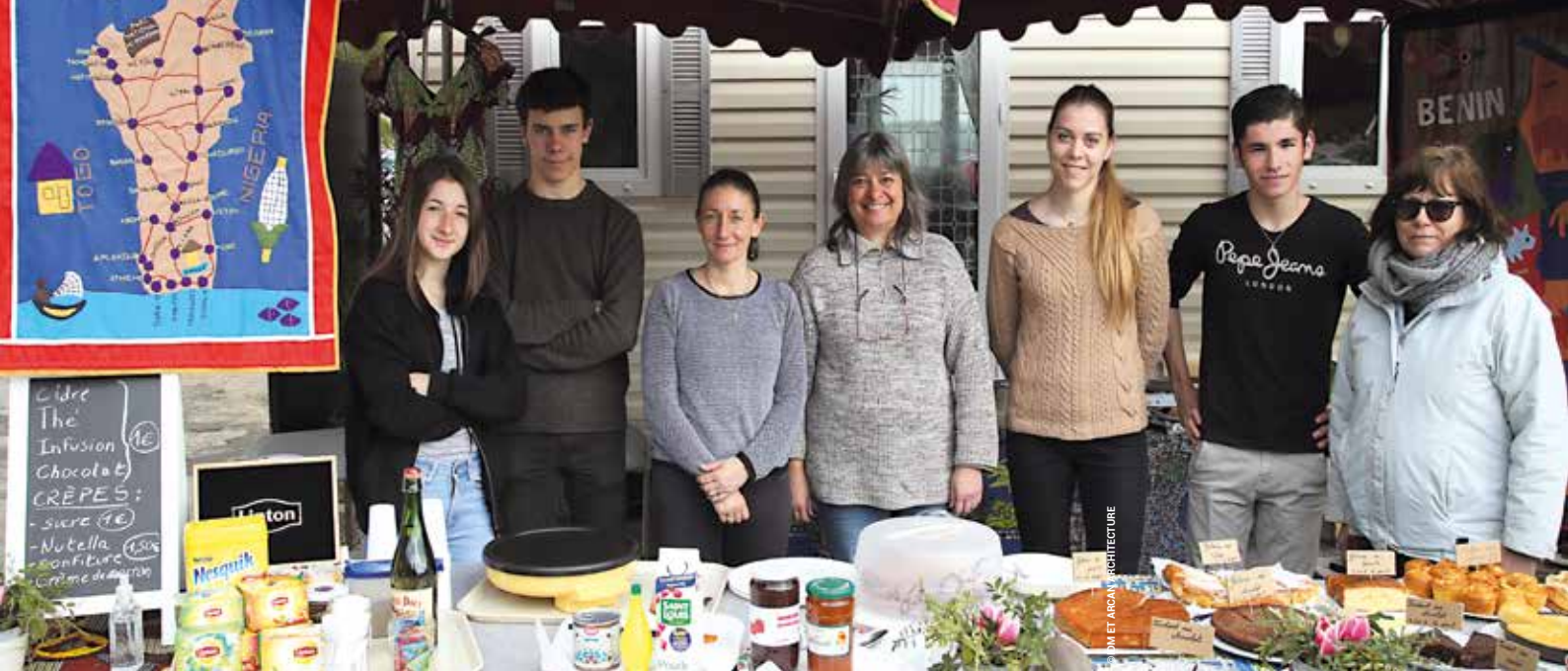
L'association «Jeunes & Solidaires» s'engage sur tous les fronts pour récolter des fonds en faveur du Bénin.