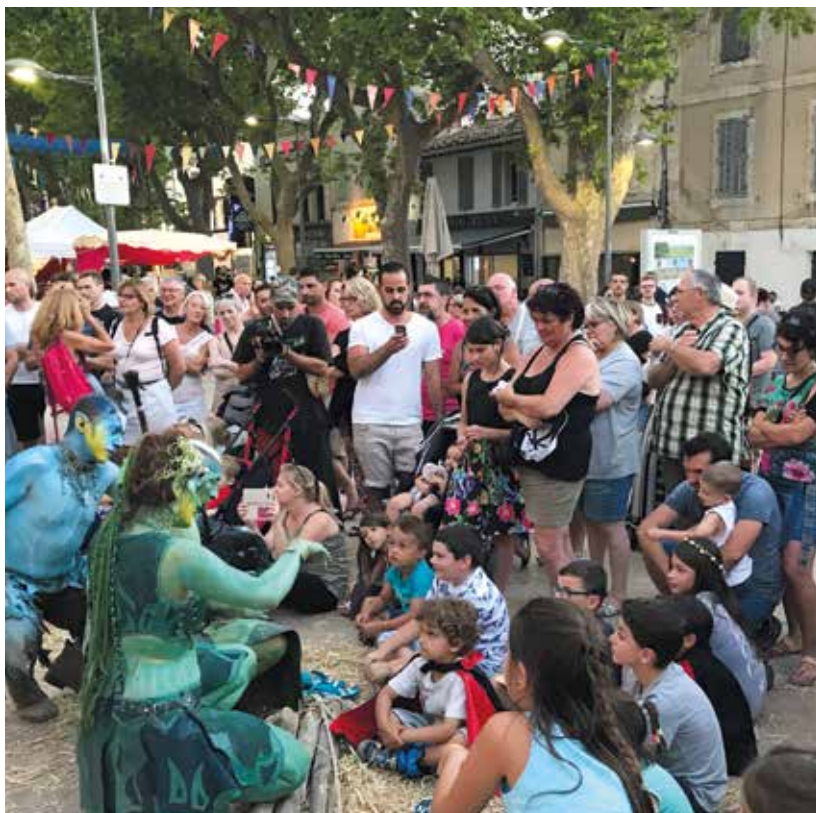
Foire médiévale de la Saint-Jean, les 10 et 11 juin 2017.