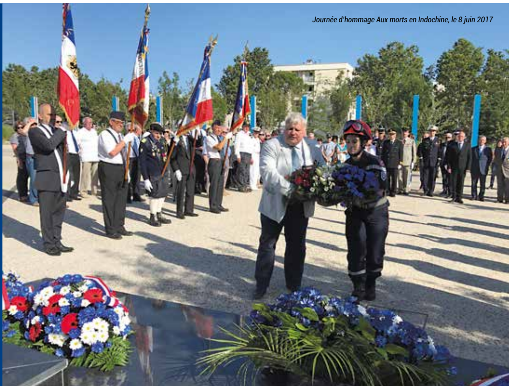
Journée d'hommage Aux morts en Indochine, le 8 juin 2017