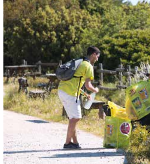
Istres Propre, samedi 13 mai 2017