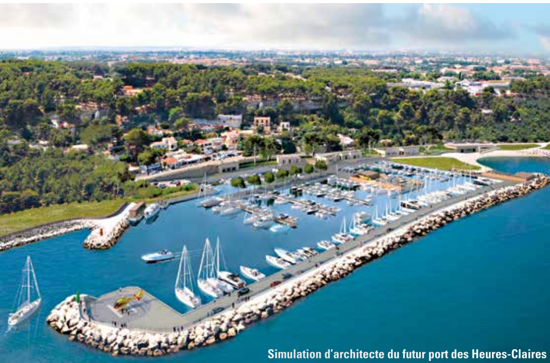
Simulation d'architecte du futur port des Heures-Clares