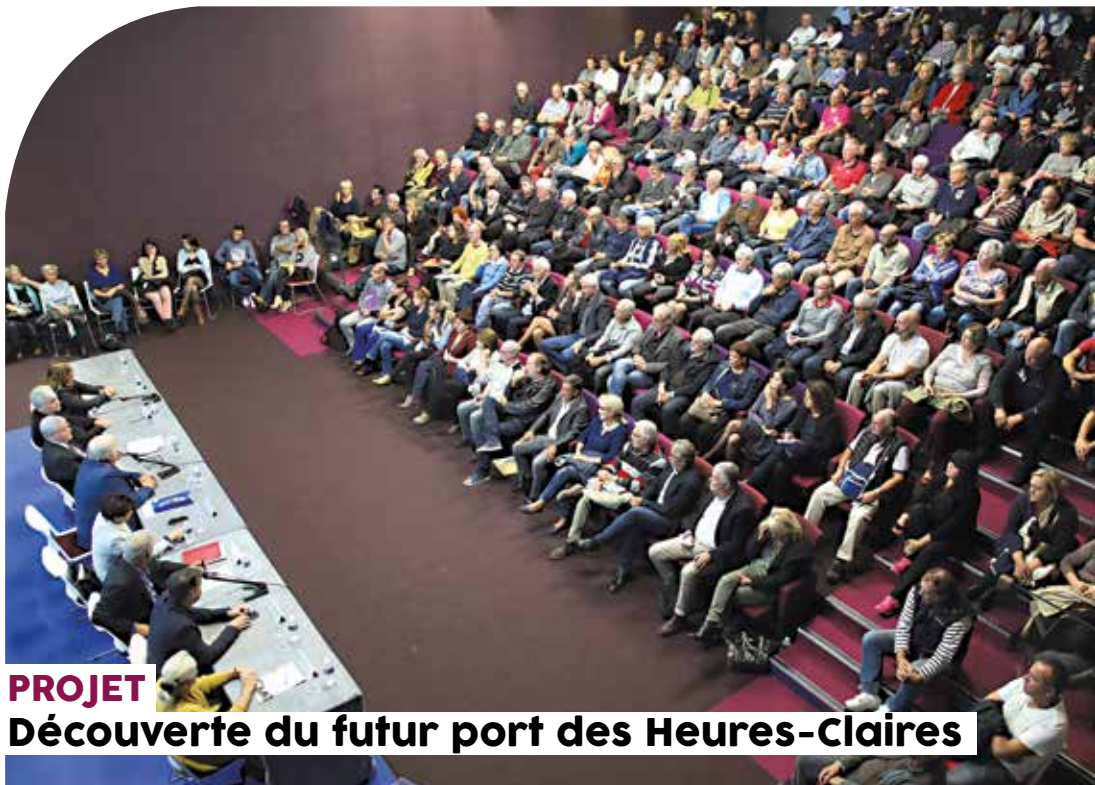
PROJET Découverte du futur port des Heures-Claires

► Il y avait foule le mercredi 26 octobre dans l'auditorium André-Noël pour assister à la présentation du projet du futur port des Heures Claires. Ainsi, le Maire, François Bernardini, entouré des architectes, a dévoilé le prochain « visage » du port de plaisance qui en fera à terme le plus moderne et le mieux équipé de tout l'étang de Berre, alliant nautisme de qualité et loisirs pour tous, tout en respectant l'environnement. Un programme de réaménagement et d'extension d'envergure, de plus de 12 millions d'euros, qui redessine totalement le port des Heures-Claires où la navette maritime trouvera toute sa place. Plus de détails sur ce projet, disponibles dans le précédent numéro d'Istres Magazine (N°284, novembre - décembre 2016), ou sur www.istres.fr rubrique Sport/Loisirs : Port des Heures-Claires.