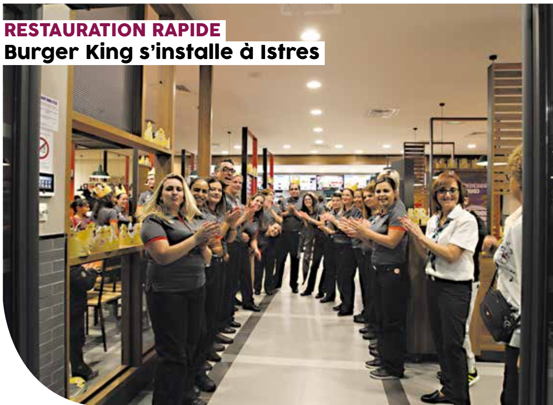
RESTAURATION RAPIDE Burger King s'installe à Istres

► Un succès incroyable ! L'ouverture du 3 e « Burger King » du département, dans le quartier de Trigance à Istres a suscité un engouement impressionnant des « fans » de ce type de restauration rapide. Durant plusieurs jours il a fallu s'armer d'une grande patience pour accéder au restaurant, tellement vous étiez nombreux à vouloir savourer le fameux whooper ! A noter que 90 emplois, localement, ont été créés avec l'ouverture de ce restaurant à Istres.