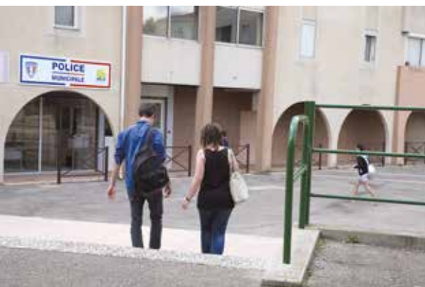
Poste de Police municipale du quartier des Échoppes