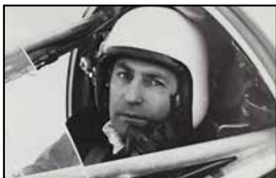
Photo extraite du livre "Épaves vers l'inconnu" de B. Barqué et J. Sarrail. (Ed. Latéales)