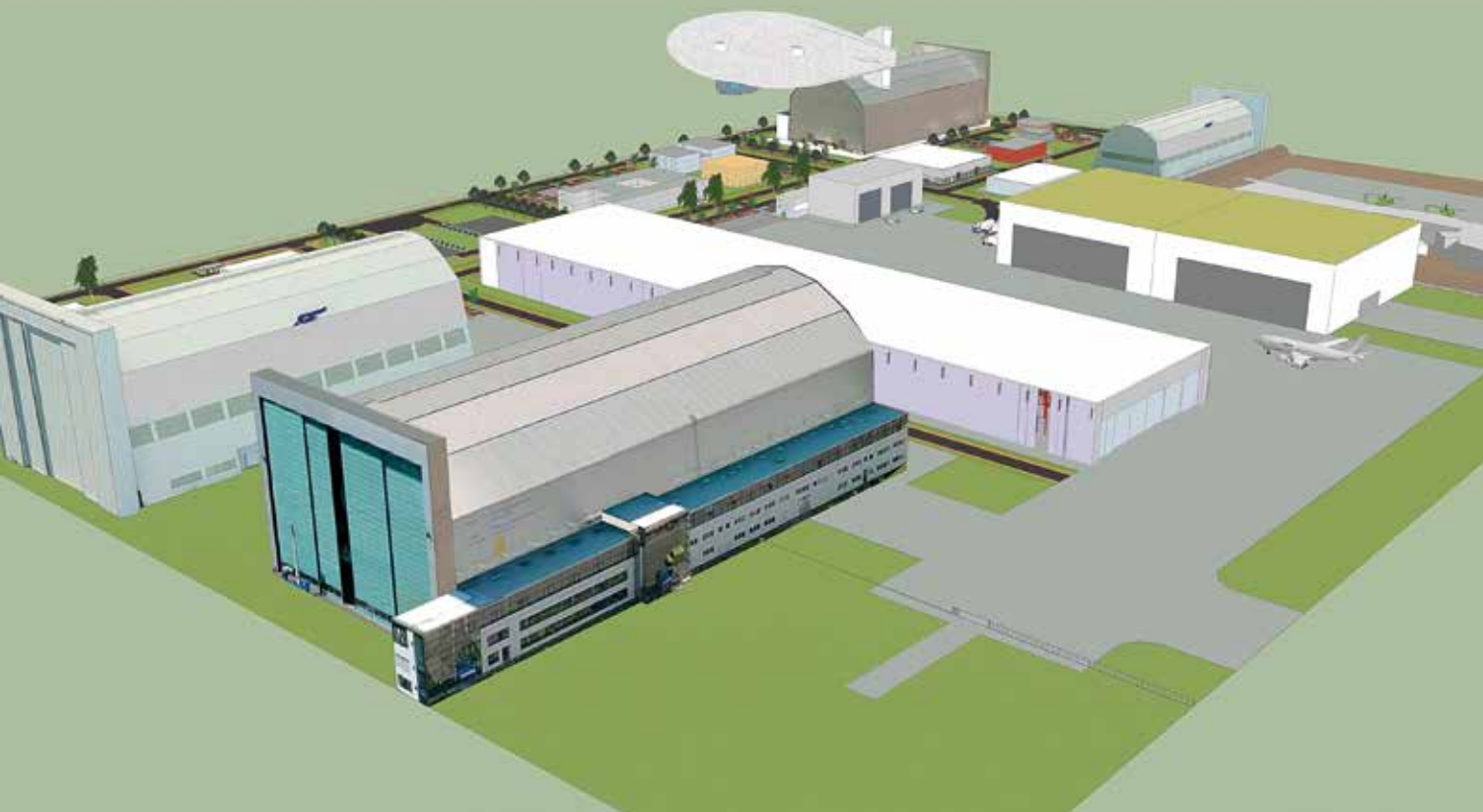
Illustration : Plan projet sous réserve de validation des différentes autorités