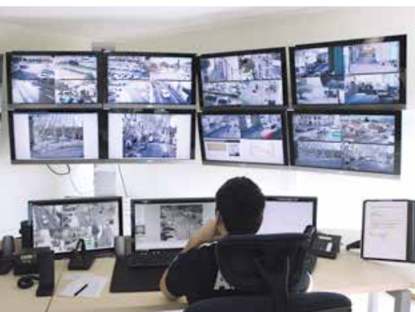
Centre de Supervision Urbaine - vidéoprotection.