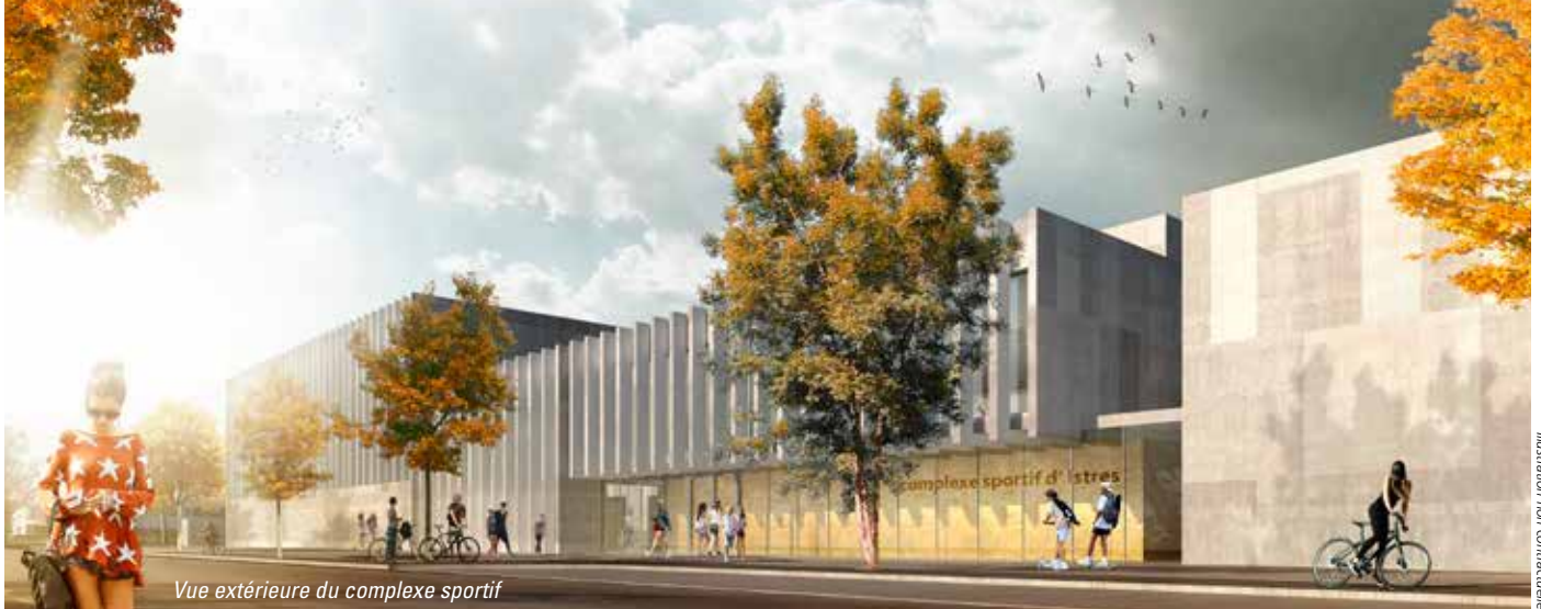
Vue extérieure du complexe sportif