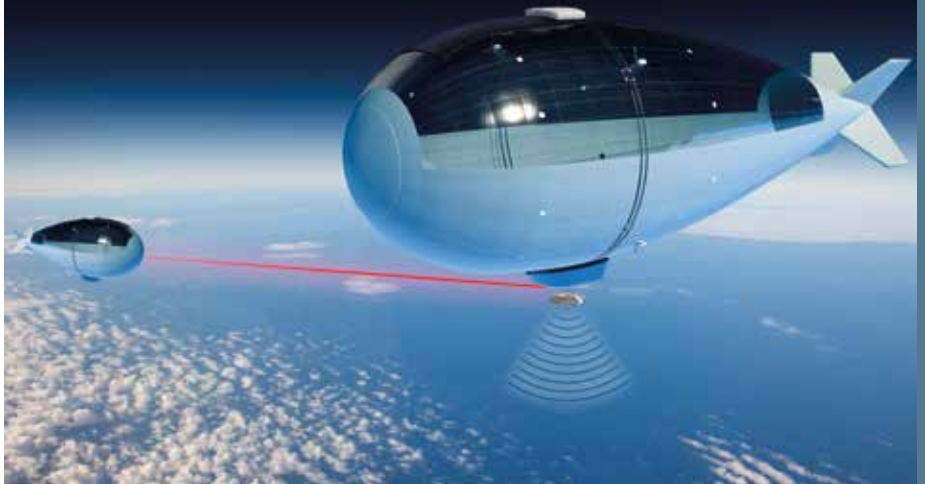
Le Stratobus du groupe Thales Alenia Space

Cannes, siège de Thales Alenia Space, signature officielle du lancement du programme STRATOBUS sur le site du Pôle Aéronautique d'Istres.