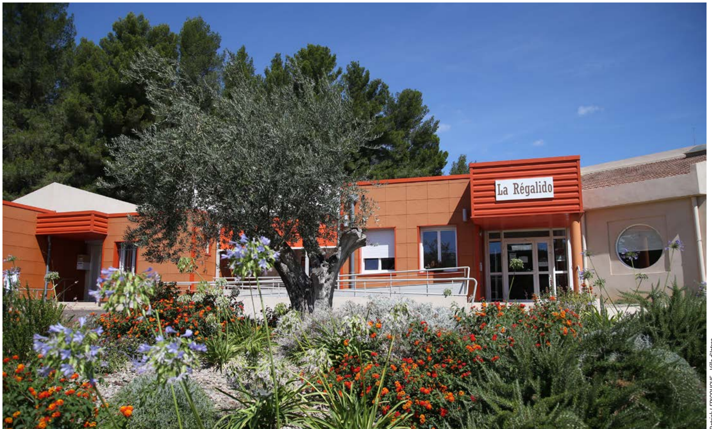
Patrick LEPICOUCHE - Ville d'Istres

“Chaque mois les foyers sont rythmés par des activités permettant aux seniors de s’impliquer pleinement dans la vie des foyers”