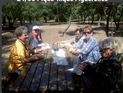
24/05 Pique-nique Figuerolles