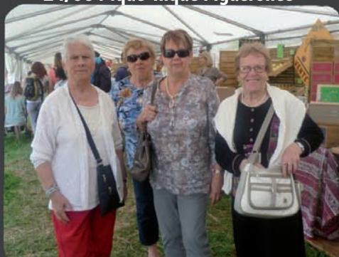
10/06 Salon de l'agriculture