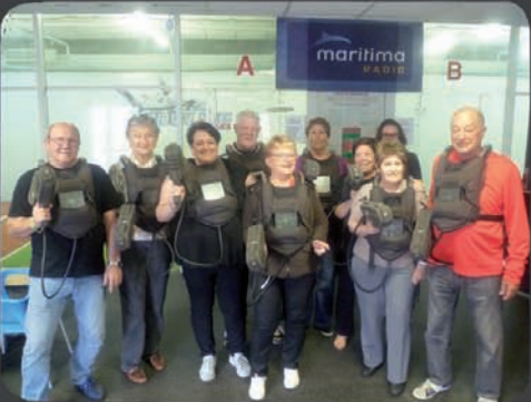
14/04 Laser Game