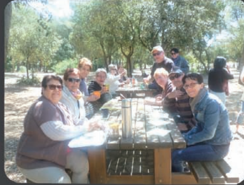
24/05 Pique-nique Figuerolles