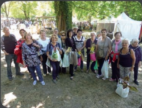
20/05 Les jardins d'Albertas