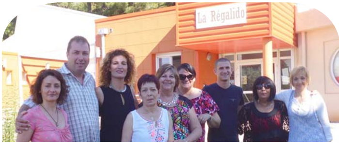
Service Animation Seniors

Les foyers de la ville, la Meraviho, le foyer de Rassuen et la Regalido accueillent tout au long de l'année, en moyenne, chaque jour, 270 seniors. Au quotidien, des animations, des moments d'échanges et de convivialité pour les seniors et par les seniors, donnent un rythme à la journée en luttant contre l'isolement, en créant un lien social et en permettant de maintenir leur autonomie. Les foyers sont directement en lien avec les services du CCAS (MAD, service transport, service petits travaux, accompagnement, travailleurs sociaux) ainsi que de nombreux autres partenaires (ITLE, le Maillon, Entraide Solidarité 13, Fil d'Ariane, Istres Sport ...). ●