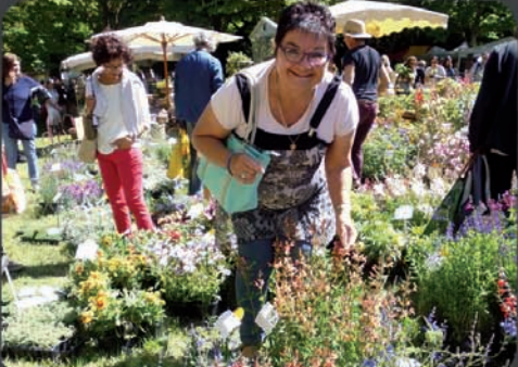
20/05 Les jardins d'Albertas