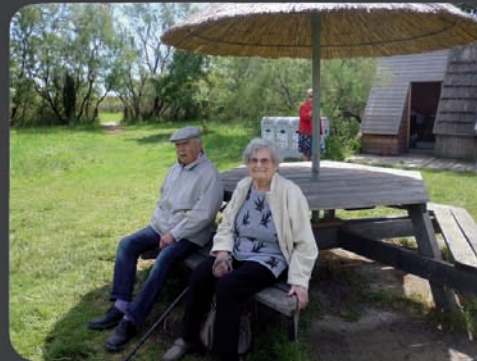
12/05 Promenade en calèche