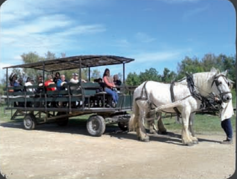
12/05 Promenade en calèche