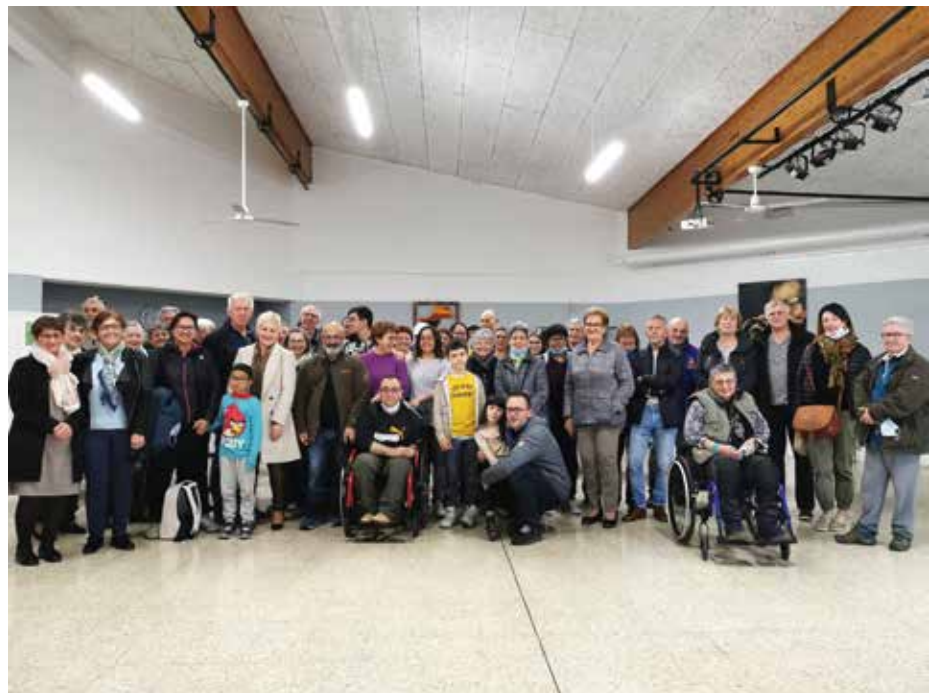
Soirée de remerciements le 25 février au CSAPM