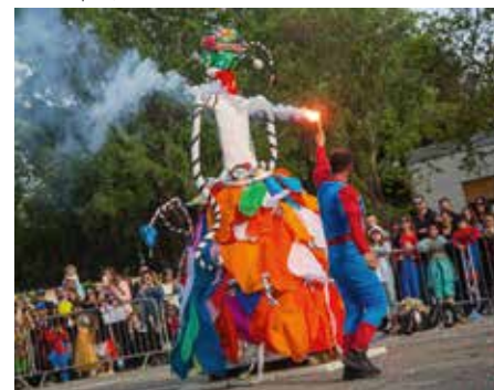
Carnaval du CSAPM le 22 avril

Aujourd'hui, grâce à un contexte qui semble plus favorable à l'organisation des événements, c'est un peu la vie normale qui reprend. Le carnaval organisé le 22 avril par le Centre Social et d'Animation Pierre-Miallet a été un véritable succès, pour le plus grand bonheur des enfants qui ont pu retrouver le plaisir du déguisement et de la parade colorée. Pour l'heure, qu'il s'agisse de la ville, du comité des fêtes d'Entressen et des acteurs de la vie du hameau, tout le monde s'active pour organiser les grands moments de l'été. À commencer le 22 mai, par le show des vieilles bécanes et vieilles guimbardes proposé à La Grange de 10h à 17h30. Au programme, exposition d'autos et motos vintage, notamment originaires pour certaines des USA... Une journée festive assortie d'un concert rock. La fête du foin retrouve également la place Lou Blagaire dimanche 12 juin de 9h à 18h. Un rendez-vous traditionnel qui proposera des animations autour du fauchage traditionnel, une mini-ferme, une foire artisanale, un marché des producteurs, des balades en calèche et des activités pour les enfants. Enfin, les fêtes votives du 1 er au 4 juillet inclus, feront battre le cœur du village (voir détail p.8).