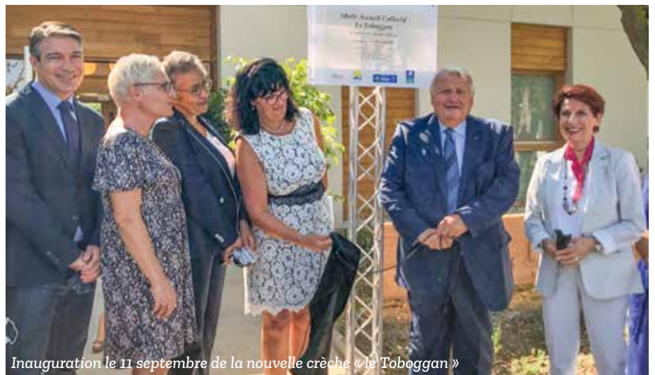
Inauguration le 11 septembre de la nouvelle crèche « le Toboggan »

et de Monica Michel députée de la 16 e circonscription des Bouches-du-Rhône. Ce nouvel équipement municipal d'un coût de 1,41 million d'Euros (financé avec l'aide de la CAF, du Département et de la Métropole), a été construit à seulement quelques mètres de l'ancienne crèche du même nom à proximité du centre social et d'animation Pierre-Miallet. La nouvelle crèche Multi Accueil Collectif (MAC) accueille désormais 22 enfants âgés de 2 mois et demi à 3 ans, répartis en deux sections bébés et moyens-grands et emploie 8 agents de la collectivité.