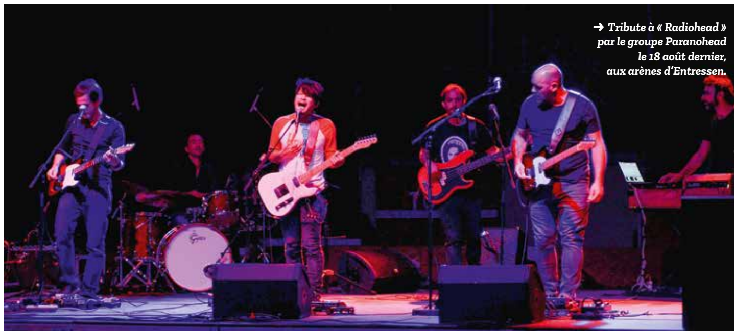
→ Tribute à « Radiohead » par le groupe Paranohead le 18 août dernier, aux arènes d'Entressen.