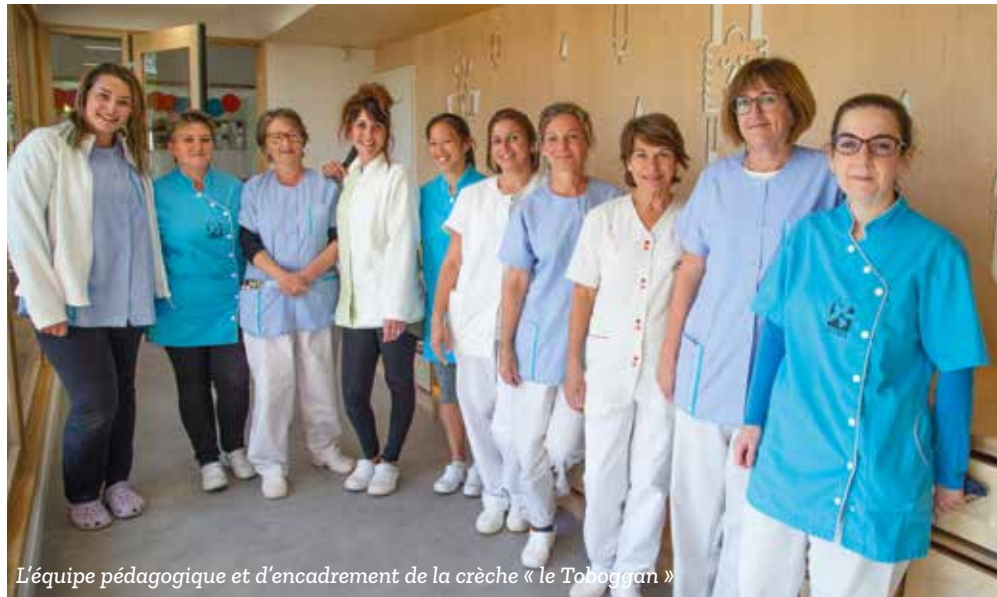
L'équipe pédagogique et d'encadrement de la crèche « le Toboggan »