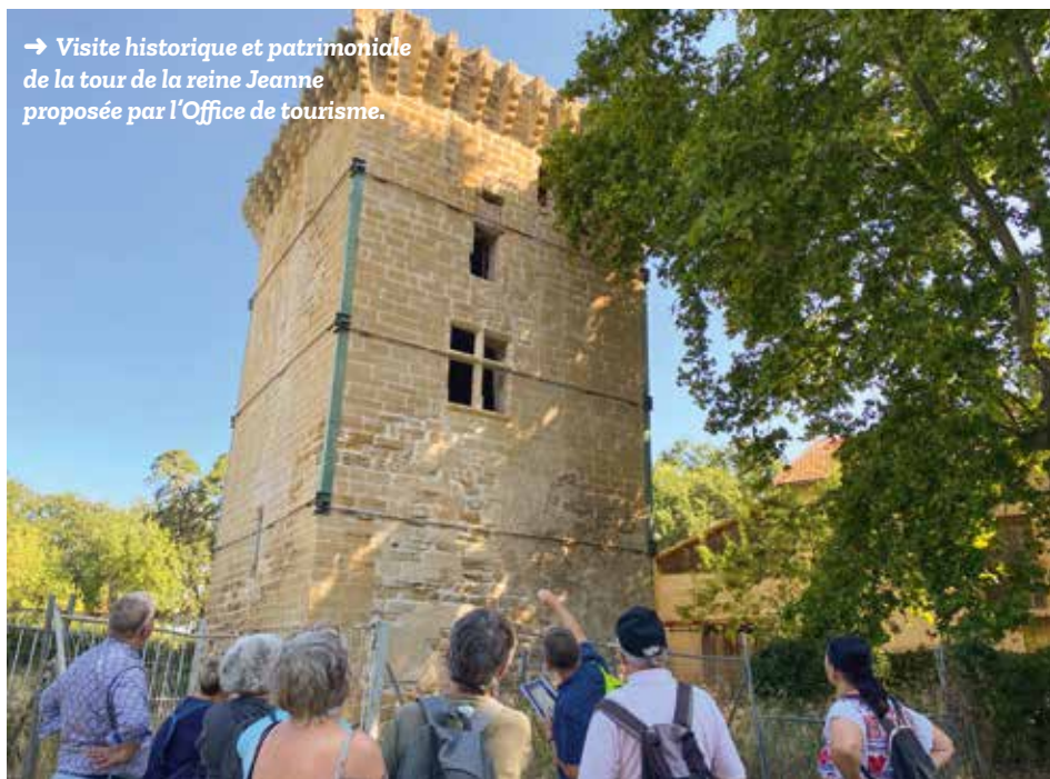
→ Visite historique et patrimoniale de la tour de la reine Jeanne proposée par l'Office de tourisme.

Une histoire sans fin et c'est tant mieux ! Car après les animations de l'été, la rentrée a laissé place à d'autres occasions de se rassembler, avec notamment la ronde des soupes le 22 octobre dernier, organisée au coeur du Centre Social et d'Animation Pierre-Miallet. Un rendez-vous suivi de près par « l'effrayante » fête d'Halloween le 24 octobre qui a réuni de nombreux entressenois grimés en quête de bonbons... sinon « un sort ! ».