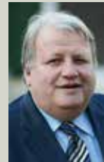
La réussite éducative pour Tous

La réforme des rythmes scolaires, cet exercice imposé dans lequel nous avons eu pour objectif unique de trouver un avantage réel pour nos enfants, s'est donc mise en place depuis la rentrée à Entressen, comme dans toutes les écoles de la ville. Un engagement qui représente pour la ville un investissement de 700 000 € chaque année, avec une participation de l'Etat de 450 000 € pendant deux ans.