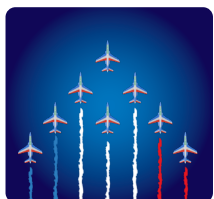
Passage de la Patrouille de France (12h40)