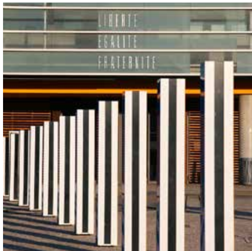
LA GRANDE DIAGONALE. TRAVAIL IN SITU POUR DEUX COULEURS PLUS LE BLANC ET LE NOIR. 57 PILIERS DE 114 A 505 CM DE HAUTEUR. ©Buren