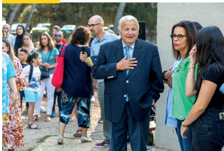
Lors de la rentrée des classes, à l'école Camille-Pierron.

Vice-président de la Métropole Aix-Marseille-Provence, délégué à la sidérurgie, à la pétrochimie et à l'aéronautique.