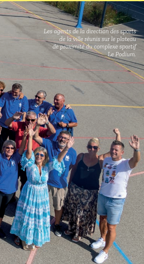
Les agents de la direction des sports de la ville réunis sur le plateau de proximité du complexe sportif Le Podium.

« Les agents se mobilisent au quotidien pour permettre d'offrir aux Istréens de tous âges des conditions optimales d'accessibilité et de confort pour la pratique sportive »